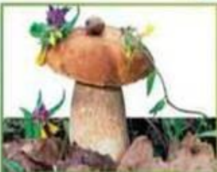
белый гриб (еловый)