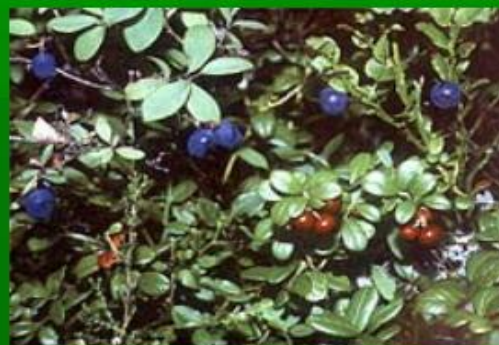
черника и брусника