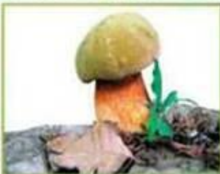
белый гриб (дубовый)