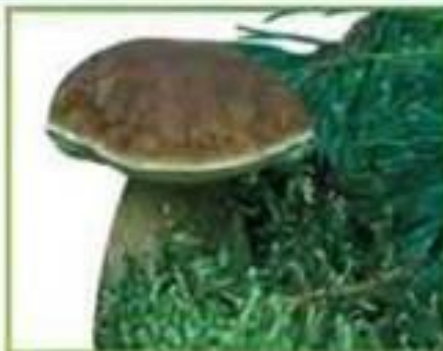
белый гриб (сосновый)